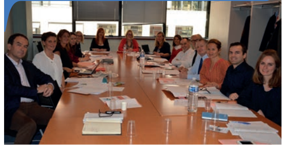
réunion du groupe de travail environnement et RSE